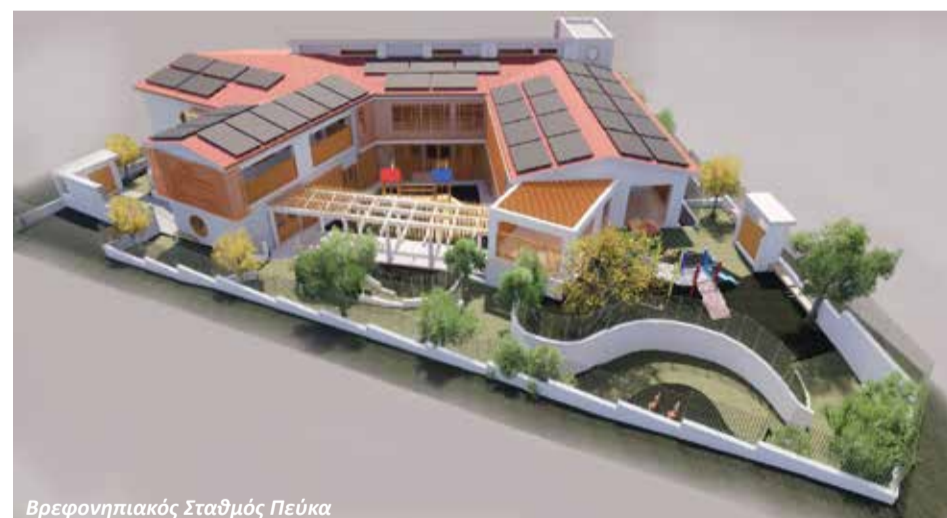
Βρεφονηπιακός Σταθμός Πεύκα