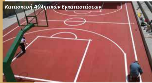
Κατασκευή Αθλητικών Εγκαταστάσεων