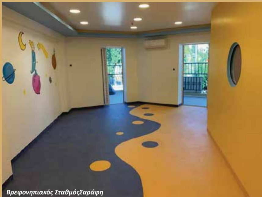
Βρεφονηπιακός Σταθμός Σαράφη

Η Σίγμα2 Τεχνική, με την πολυετή εμπειρία και εξειδίκευσή της σε έργα ανέγερσης, συντήρησης και αδειοδότησης Βρεφονηπιακών Σταθμών και Σχολικών συγκροτημάτων, αναλαμβάνει τη μελέτη, το σχεδιασμό, την κατασκευή εκ θεμελίων ή ανακατασκευή τους, μέχρι και την τελική αδειοδότησή τους.