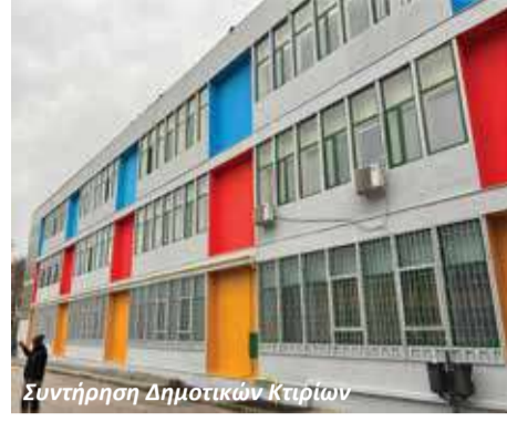
Συντήρηση Δημοτικών Κτιρίων