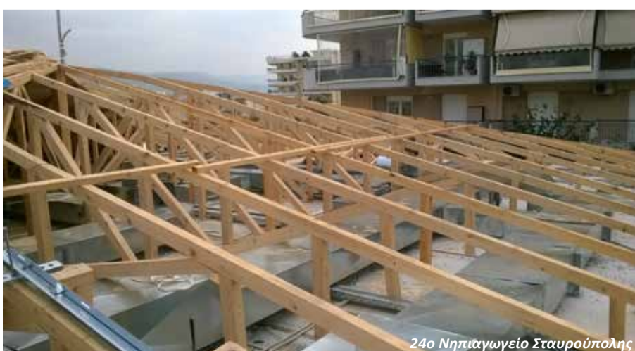
24ο Νηπιαγωγείο Σταυρούπολης

Με αυστηρή προσήλωση στις αρχές: Επαγγελματισμός στελεχών και προσωπικού – Συνέπεια - Τελειομανία - Τεχνογνωσία - Εξοπλισμός , Άριστη Τεχνική και Νομική Κατάρτηση , συνεχίζουμε αποδεικνύοντας καθημερινά την ποιοτική ανωτερότητα, σε όλα τα επίπεδα, σε σχέση με τον ανταγωνισμό.