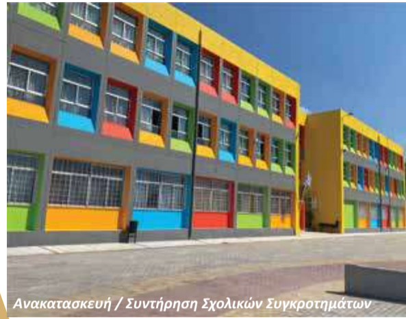
Ανακατασκευή / Συντήρηση Σχολικών Συγκροτημάτων