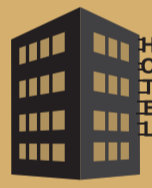
ΤΟΥΡΙΣΤΙΚΑ - ΞΕΝΟΔΟΧΕΙΑΚΑ ΚΑΤΑΛΥΜΜΑΤΑ