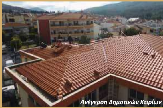
Ανέγερση Δημοτικών Κτιρίων